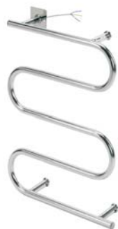
Model HT- 60S Størrelse: 643 x 470 x 125 mm Effekt: 60W / 230V / 50Hz Materiale: Rustfrit stål Finish: Børstet