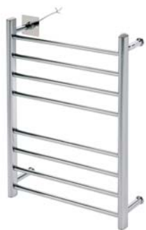
Model HT- 90H Størrelse: 750 x 510 x 140mm Effekt: 90W / 230V / 50Hz Materiale: Stål Finish: Krom