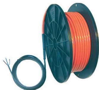
HandyCable DVT-20 - 20 Watt/meter